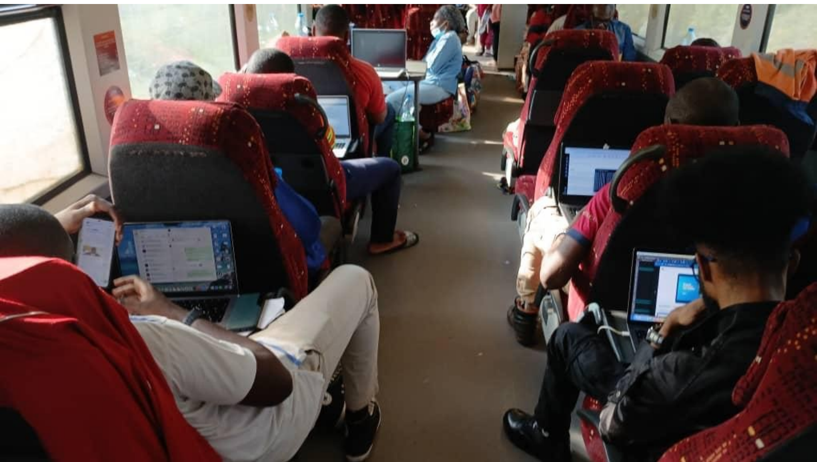
Connectivité OneWeb LEO à bord d'un train au Gabon